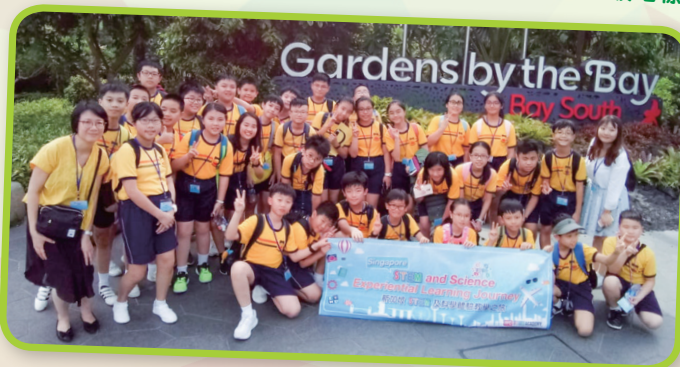
我們在濱海灣花園前拍照留念。