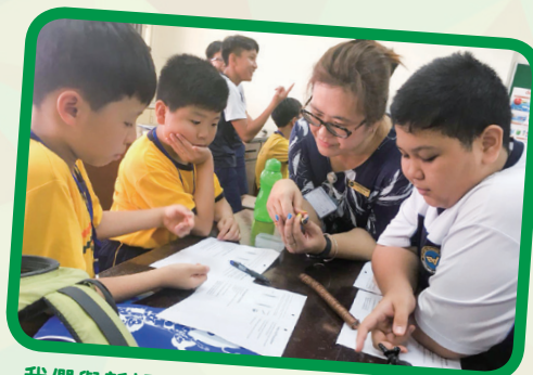
我們與新加坡東景中學的學生互動學習。