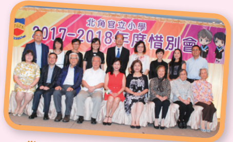
當天有不少嘉賓出席同學的畢業禮暨惜別會，來張合照吧！