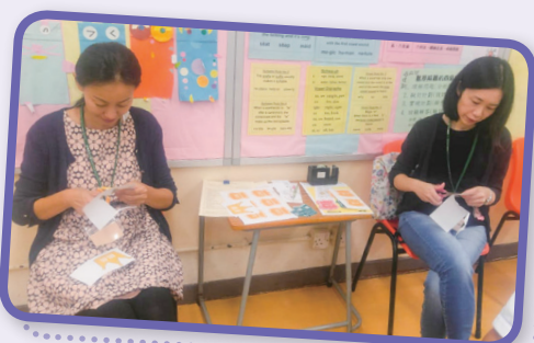
家長義務助教協助老師製作教具。