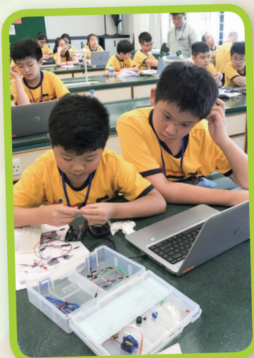
同學參與刺激思考的 micro : bit學習活動。