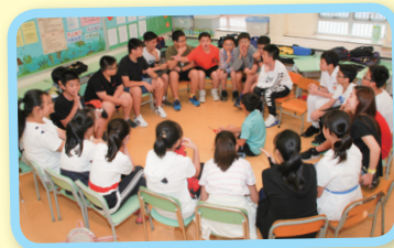
大家分享自己的近況。