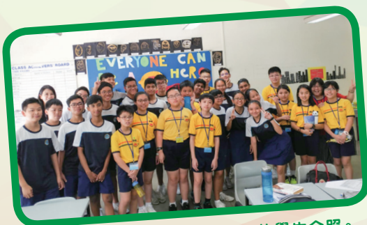
本校同學與新加坡東景中學的學生合照。