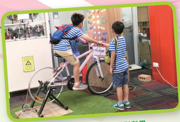
「親身的嘗試」幫助孩子對科學原理的「理解」。