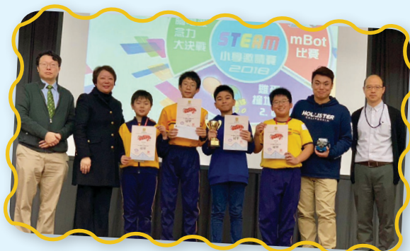
同學在校外mBot機械人自動車比賽中勇奪冠軍。