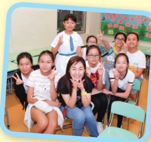
與昔日任教的老師見面，一定要合照留念。