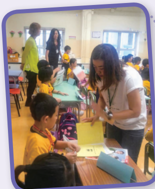
小息時，家長義務助教在課室照顧同學。