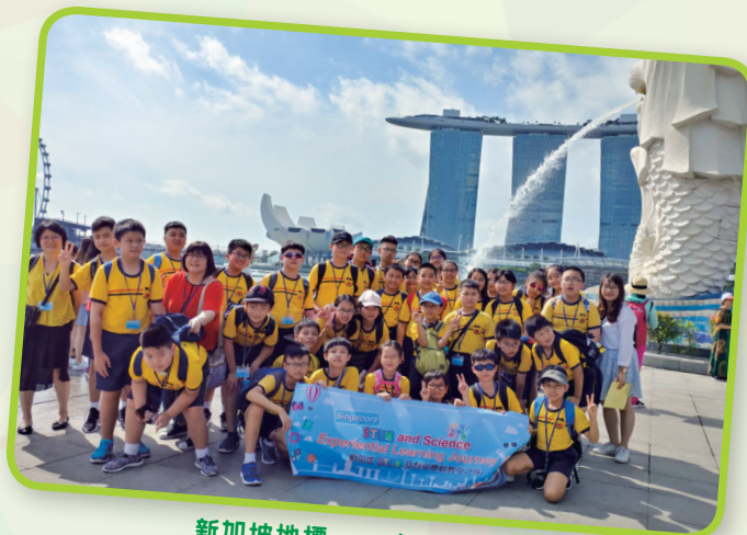
新加坡地標——魚尾獅公園