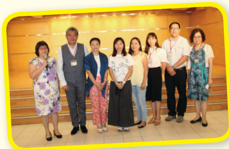
家長教師會委員在台前向家長打招呼。