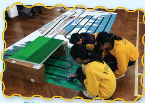
同學編寫程式後進行場地測試。