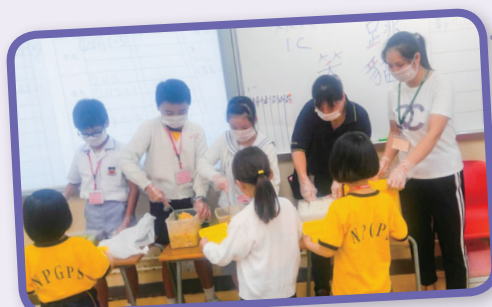
家長義務助教協助同學分發午餐。