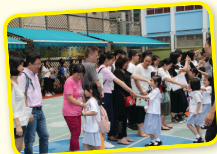
家長牽着學生的小手愉快地回家。