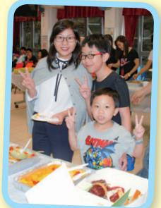
美食在前，同學也要與校長合照留念。