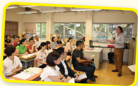
外籍英語老師跟家長傾談。