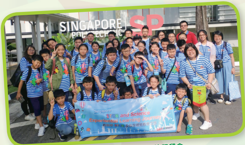
大家在新加坡理工學院前拍照留念。