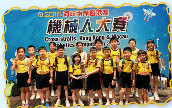
同學代表學校參加比賽並取得季軍。