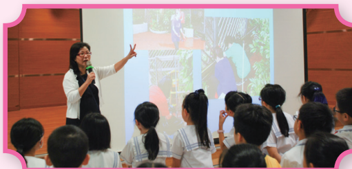
校長教導同學珍惜所有，心存感恩。