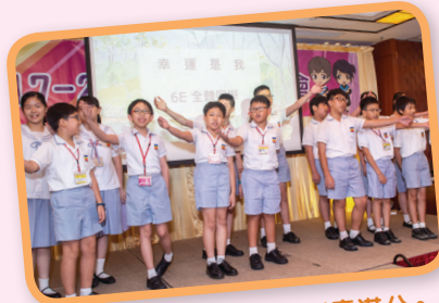
表演環節，畢業同學創意滿分。