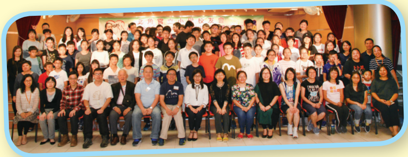
校長、校友會委員、老師和校友來張大合照。