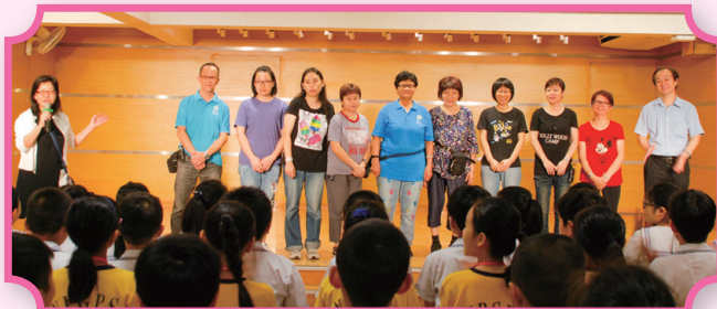
齊來向工友叔叔和姨姨致敬。