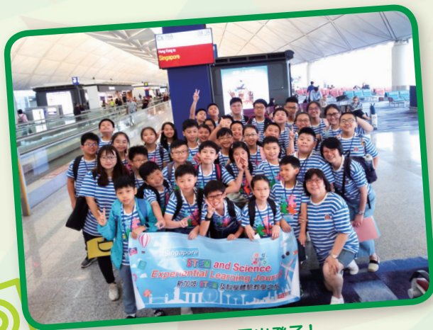
興奮的我們要出發了！