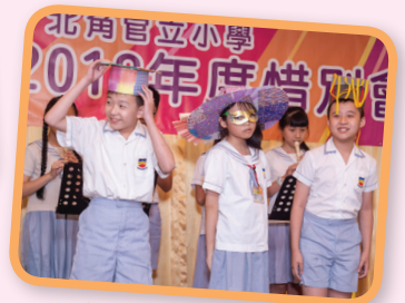
畢業同學以不同表演向師長表達謝意。