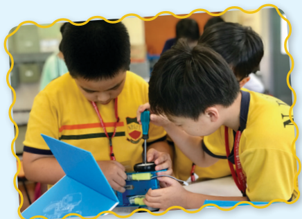
同學嘗試運用不同的工具建造和改裝mBot。