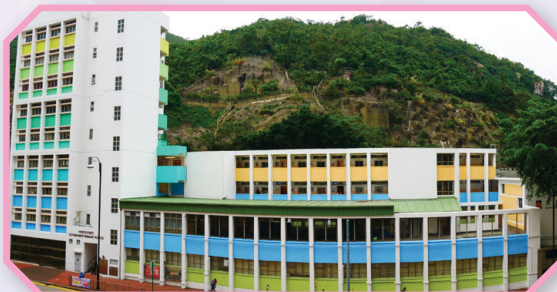
北官換上漂亮的新裝了！