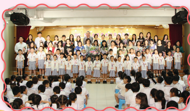
家長及同學們向老師送上敬師卡及鮮花，以表謝意。

除校長十分關顧同學的身心發展外，老師們也不辭勞苦地抓緊每一天跟同學接觸的時間，協助同學解決學習上的難點及教導他們做人處世的技巧，可謂無微不至。師恩比海深，當天，家長及同學們都把握敬師日的到來，紛紛向師長送上敬師卡及鮮花，以表謝意。師長看到大家的心意，當然十分高興，然而同學們若能好好把握學習的機會，牢記師長的教誨，努力實踐「真、善、美」這些美德，相信師長一定會更滿足，更為你們感到自豪。