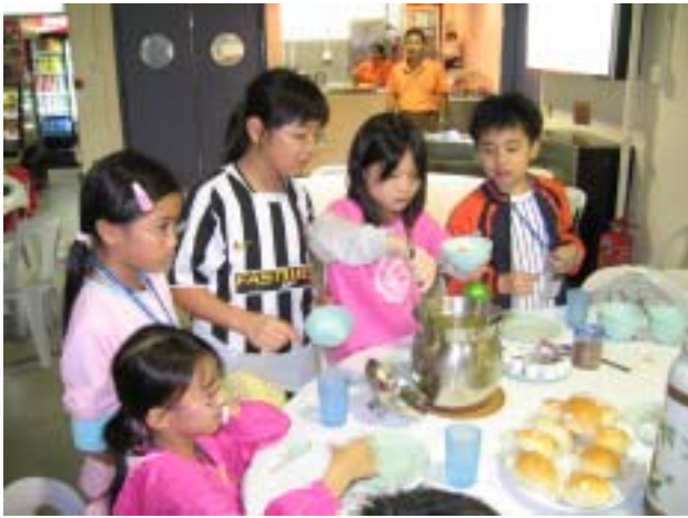
親手盛的湯、飯，一定更美味！

轉眼間，五天教育營過去了，離營的那一天，同學們背著行李登車，懷著依依不捨的心情向工作人員揮手道別，結束了這段增廣見聞的難忘且快樂日子。