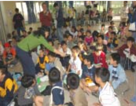
學科活動同樣生動有趣。