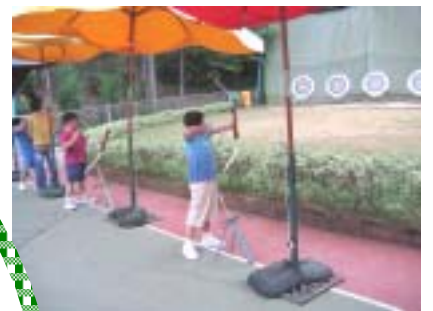
你看！我的箭術多厲害！

不要錯誤的詮釋別人的好意，那只會讓自己吃虧，並且使別人受辱。在不明所以之前，先學會按捺情緒，耐心觀察，以免事後生發悔意。