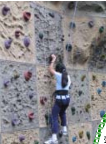
加油！就快攀到頂了！