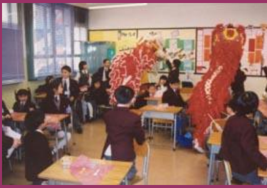
獅子到每個課室表演，逗得同學們樂哈哈。

【本報訊】光陰似箭，日月如梭。轉眼間，又迎來了二零零二年度的新年聯歡會。二月八日的早上，我的全體師生們，帶著無比輕鬆的心情迎接新年聯歡會。 首先，大家於課室品嚐學校特意購買的大量蘿蔔糕、年糕及各式賀年糖果，真比家裏的還豐富！有的同學吃得津津有味，十分認真嚴肅，儼然在上課一樣，有的一邊吃，一邊聊天……說話聲、歡笑聲連成一片，盪漾在校園裡。 接著，傳來了一陣鑼鼓聲，原來是舞獅開始表演了。同學們顧不得吃，趕忙擠在人群中看表演。獅子不斷揮舞，一會兒由上而下，一會兒由下至上，動作優美，富節奏感，令人賞心悅目，觀賞的同學們更不斷報以熱烈的掌聲，真的是一片喜氣洋洋，生機勃勃，熱鬧非凡。 最後，同學們盼望已久的「利是」終於現身了，由各班的班主任以長輩的身份派給學生，同學們一接到「利是」就迫不及待地把它拆開。瞧！裡面有一個大巧克力金幣、麥當勞餐廳的現金券，更有老師給我們的祝福語。此外，學校還送給每位同學一份文具作為新年禮物，樂得同學們眉開眼笑。 聯歡會在一片歡笑聲中結束了，師生們同樂的一天，確實讓人回味。 撰稿人：施方儀 (6A)