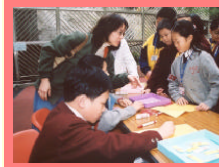
學生也來當老師，帶領其他同學進行遊戲，挺不錯的。

在一個真實而輕鬆的環境下，運用英語完成各項活動，以培養學生對學習英語的興趣和增強他們運用英語的自信心。當天，老師安排學生進行不同的英語活動，如英語遊戲等。同學們需要拿著一張紙去玩不同的語遊戲，只要玩對了，就可得到一個印章呢！遊戲攤位共有十一個，帶給同學無窮歡樂。場面非常熱鬧。之後，老師又帶我們到禮堂聽聽一些同學介紹自己喜歡的物品和玩猜字遊戲，同學們都感到很开心。