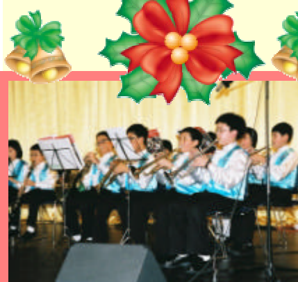
管樂團的學生為大家送上聖誕歌聲，繞樑三日。