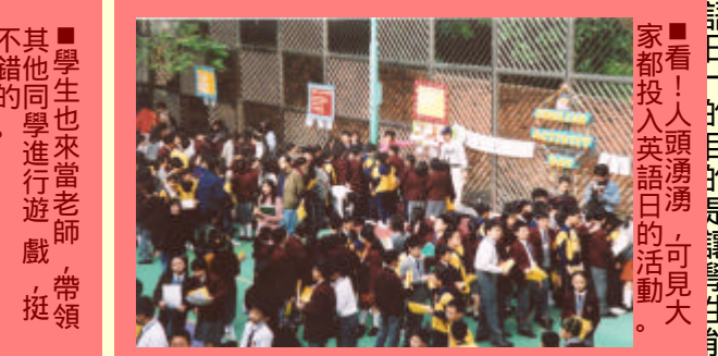
看！人頭湧湧，可見大家都投入英語日的活動。