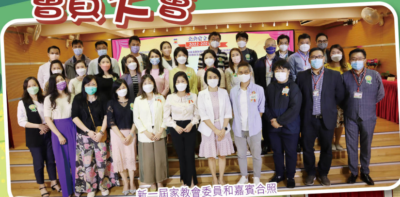
新一屆家教會委員和嘉賓合照