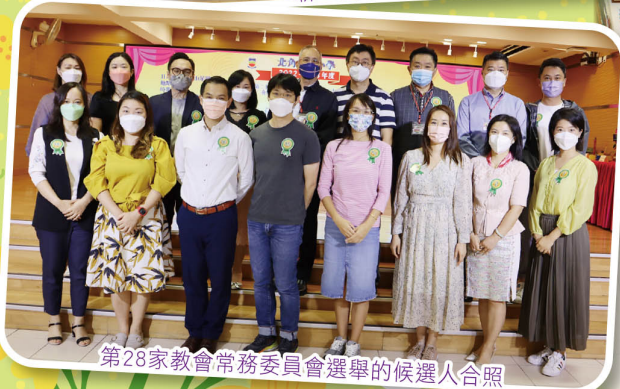
第28家教會常務委員會選舉的候選人合照