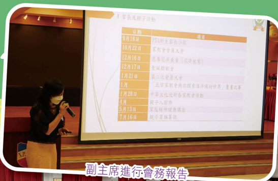
副主席進行會務報告