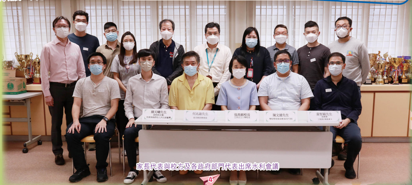
家長代表與校方及各政府部門代表出席水利會議