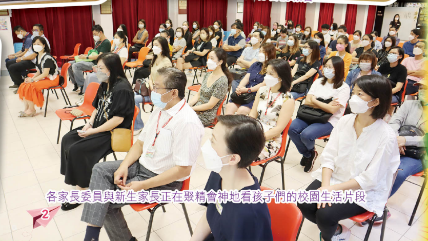
各家長委員與新生長家正在聚精會神地看孩子們的校園生活片段