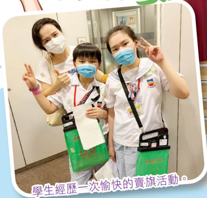
學生經歷一次愉快的賣旗活動。