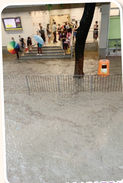
雨季期間，學校門口往往會發生嚴重水浸。