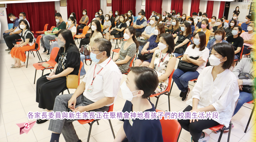
各家長委員與新生家長正在聚精會神地看孩子們的校園生活片段