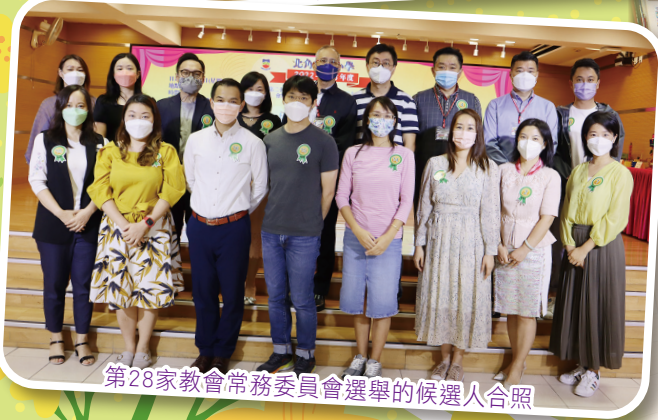
第28家教會常務委員會選舉的候選人合照