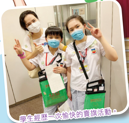
學生經歷一次愉快的賣旗活動。