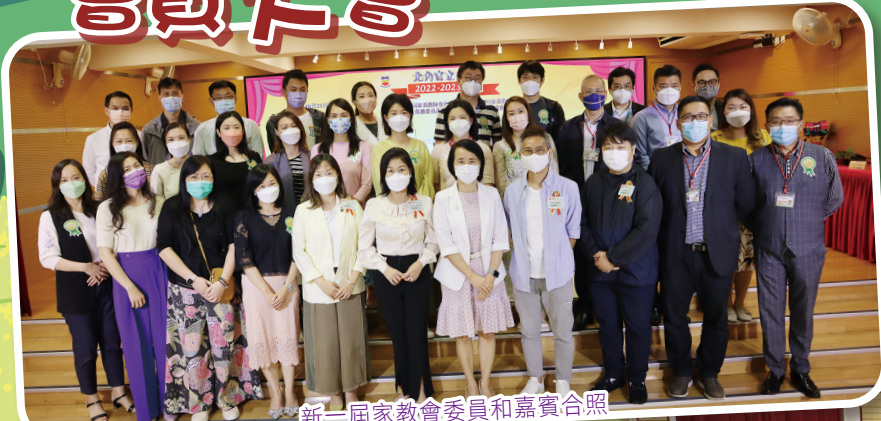
新一屆家教會委員和嘉賓合照