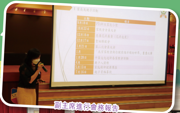
副主席進行會務報告