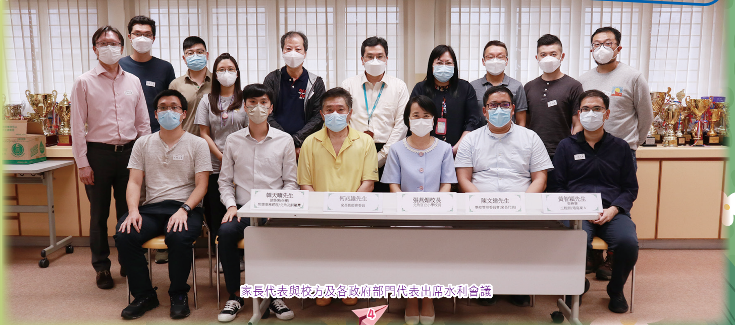
家長代表與校方及各政府部門代表出席水利會議