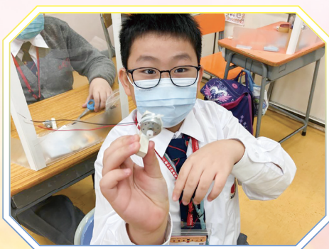
「我把馬達安裝好啦！」 同學心情很興奮。