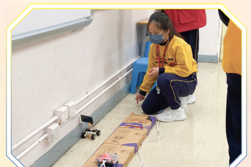
同學正在測試太陽能電動車。