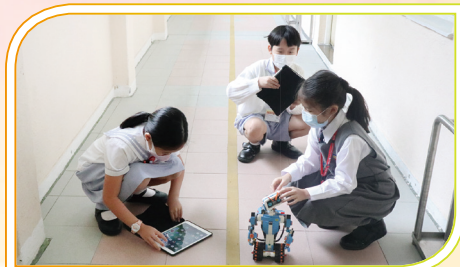
同學正在輸入指令，控制Lego機械人的動作。