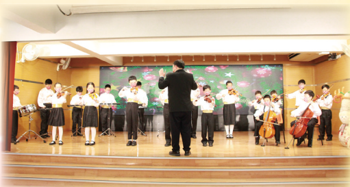
管弦樂團演奏的多首聖誕樂曲為校園帶來濃厚的聖誕氣氛。