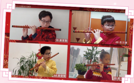
中樂笛子小組吹奏的樂曲扣人心弦。