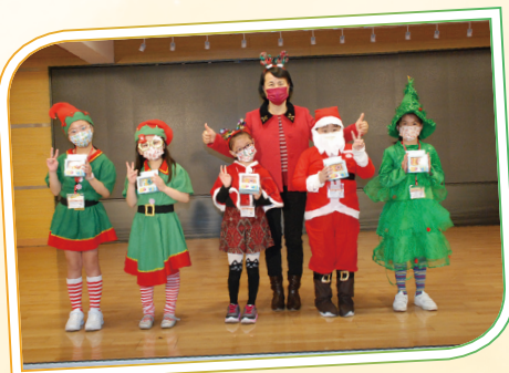
看！低年級班際「聖誕人物造型」比賽得獎者的扮相多富心思。