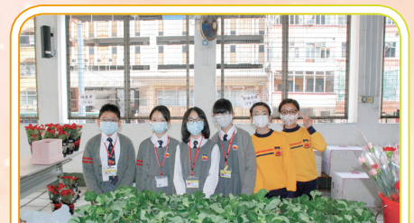
在這次籌款活動中，公益少年團團員是老師的好助手。