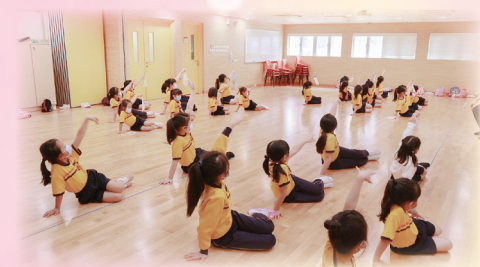
中國舞班的同學舞姿優美。