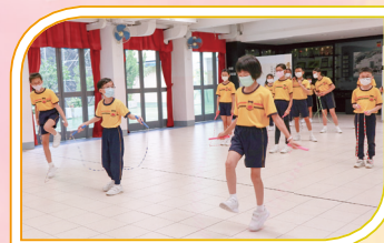
花式跳繩，樂趣無窮！