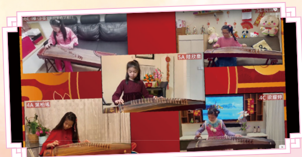
中樂古箏進階班的同學，向大家展示在Zoom課餘興趣班中的學習成果。