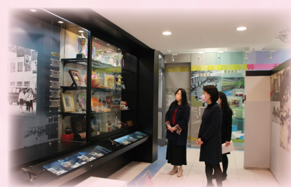
張校長帶領黃校長到歷史閣參觀。