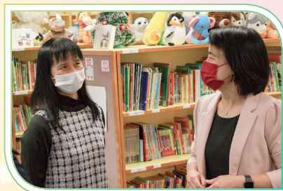
張校長帶領梅校長到圖書館參觀。