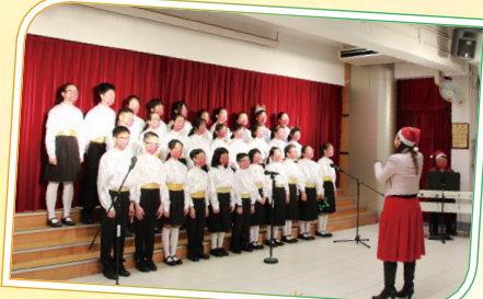
高年級合唱團團員在鍾老師的帶領下獻唱悠揚的聖誕歌曲。