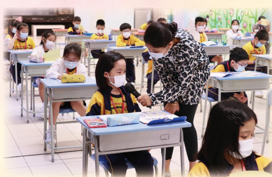
Answering a question from the storybook.