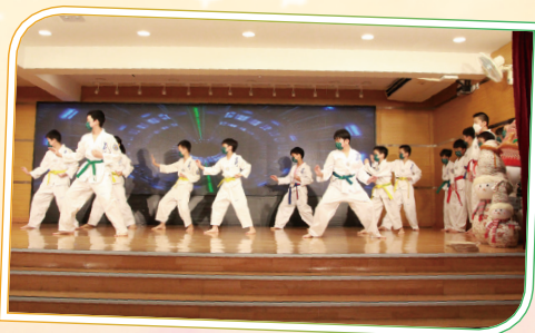
觀眾聚精會神地欣賞跆拳道表演。