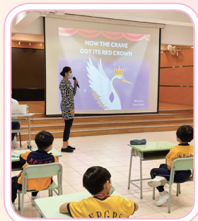
The teacher from SCOLAR introduces the storybook on the big screen.