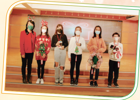
在高年級班際聖誕吊飾創作比賽中脫穎而出的得獎者與校長合照。