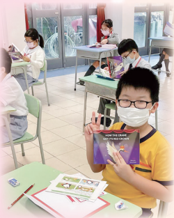
Let's get ready to read the book together!