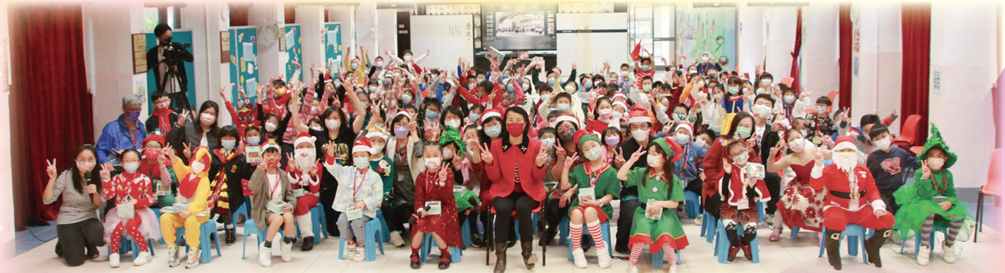
熱鬧歡樂的聖誕聯歡會為同學們帶來了美好的回憶。