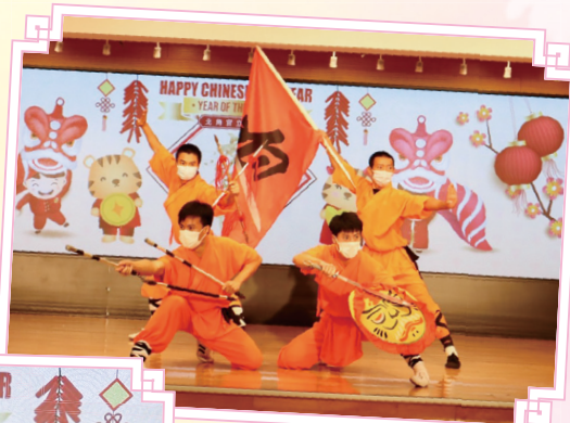
少林寺多位武術精英在學校禮堂表演武術，令人歎為觀止。透過直播，安坐家中的同學看得入神。