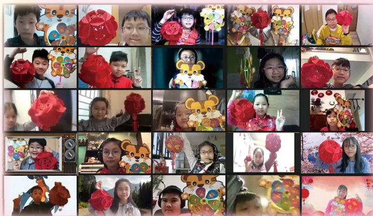
同學們在老師的帶領下一同完成賀年吊飾，為家中添姿采。