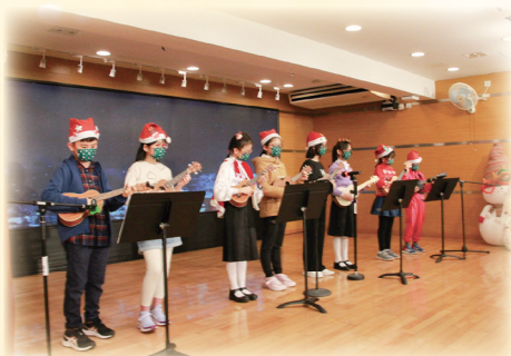
同學以夏威夷小結他演奏出清新悅耳的聖誕樂曲。