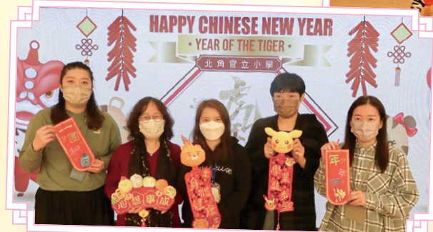
老師攝錄了恭賀的片段，祝賀大家「身體健康」。