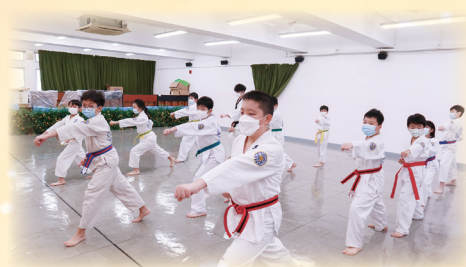
學習跆拳道同學們扎穩馬步，出拳鏗鏘有力。