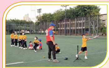
看！同學正拿着棒球棍準備擊球。