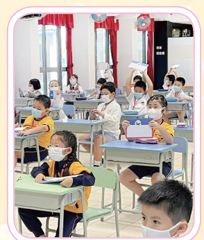
Students were encouraged to share their work to the whole class.