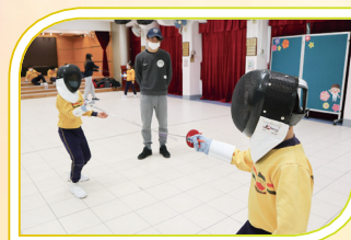
同學正進行劍擊活動，真刺激！