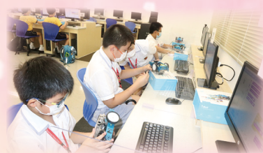
同學們全神貫注地進行編程活動。