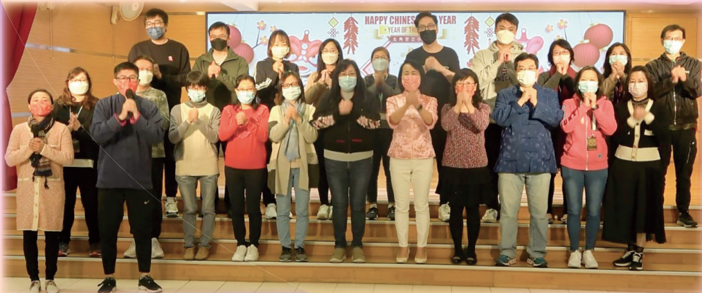
校長和各位老師齊齊祝賀大家「虎虎生威」。