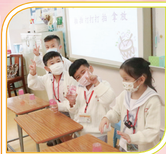
拍拍拍！我們都是小小音樂家。「常識特務」發射自製的「氣球火箭」，真刺激！