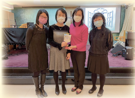
張校長（左二）、李副校長（右一）及曾主任（左一）與懷恩浸信會幼稚園朱校長（右二）合照。

未來，本校會與各友校幼稚園繼續保持緊密的聯繫及溝通，使能更準確掌握幼稚園生的興趣、需要及能力，以優化校本幼小銜接計劃，讓入讀本校的幼稚園生更輕鬆愉快地升讀小一，及早適應小一的學習生活，為未來的學習打好基礎。