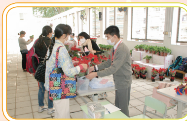
家長慷慨解囊，積極支持這次籌款活動。

參與慈善活動是一件樂事，怪不得在當天籌款活動的場地所見，家長、老師和學生的笑容比花兒更燦爛呢！