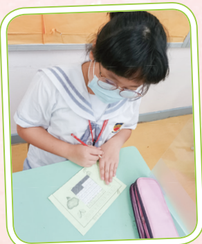
小二同學認真地製作萬年曆。