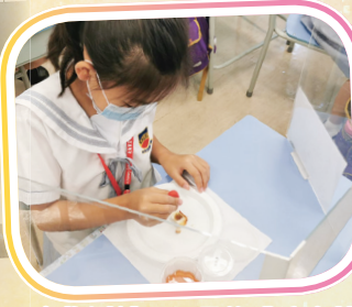
食物測試——最後碘液會轉 甚麼顏色呢？