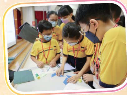
應該怎樣拼才好呢？