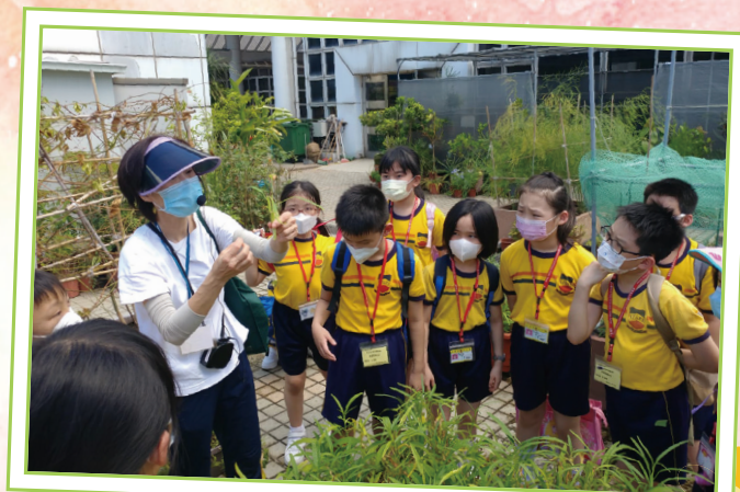
同學們留心聆聽導賞員講解不同植物的特性。