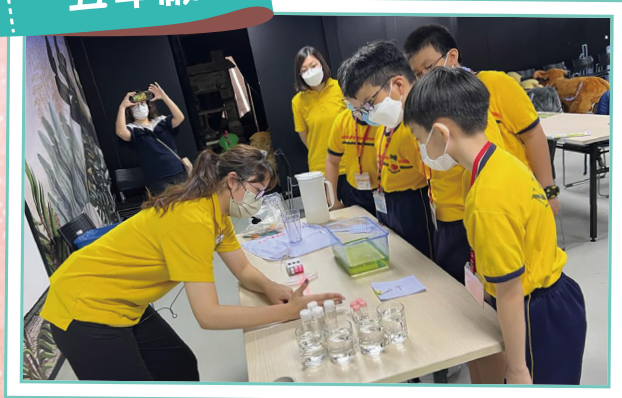
同學們輪流參與挪亞方舟學堂的光學遊戲室和能源拯救隊的探究活動。