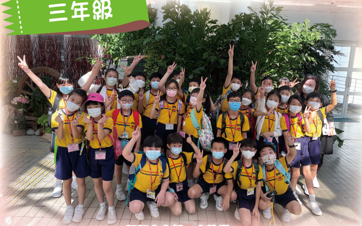
親親大自然，多快樂！