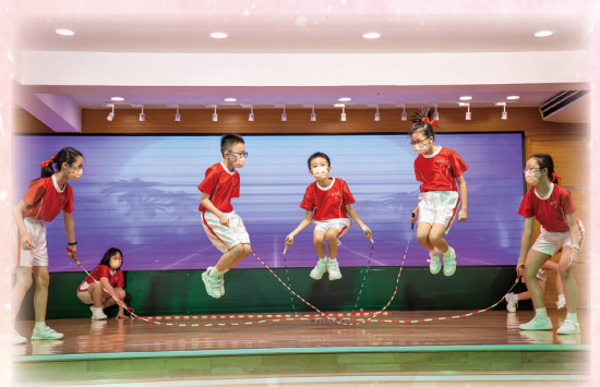
有充滿活力動感的花式跳繩表演助興，使畢業禮增添熱鬧氣氛。