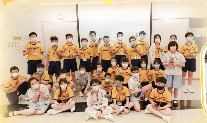
同學展示在「機械變色龍」活動中完成的作品。