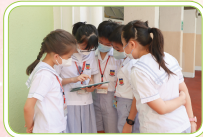
小四同學在操場、禮堂和三角操場進行「數學遊蹤」。

學校舉辦一連串數學科活動，目的是希望學生以各種方式體驗、學習和應用數學，提升他們學習數學的興趣及鞏固他們的知識。