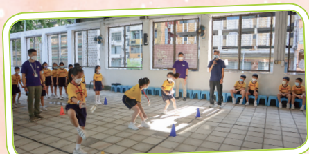
班際馬拉松比賽體現同學堅毅的精神。