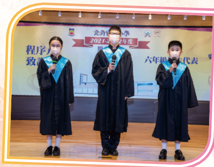
三位六年級同學分別以粵語、英語和普通話致謝辭。