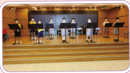
Students got ready for the competition.

This July we were able to resume our Annual Spelling Bee Competition! Part one of the event was an in-class round to determine the winners for each class. From 13 th to 15 th of July, the top two winners of each class competed in the hall to determine the champion in each grade level. The finalists were very impressive spellers, Mr. C even had to create an advanced level list of words to crown the champions. A fun event and congratulations to all the winners!