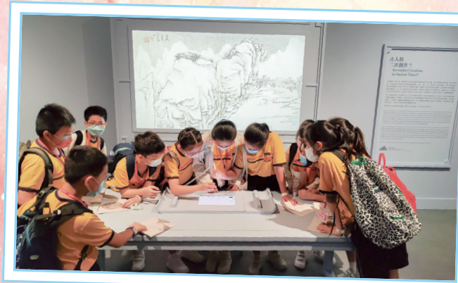
同學踴躍地參與展品的互動遊戲。