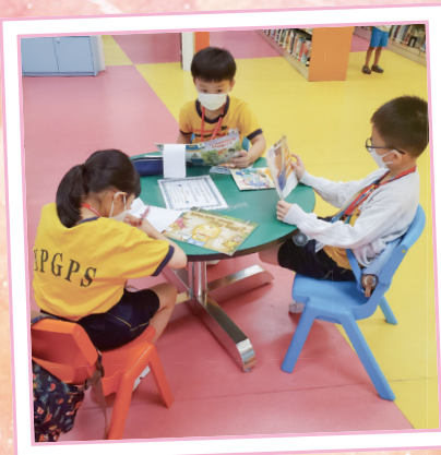
同學們專心地閱讀圖書。