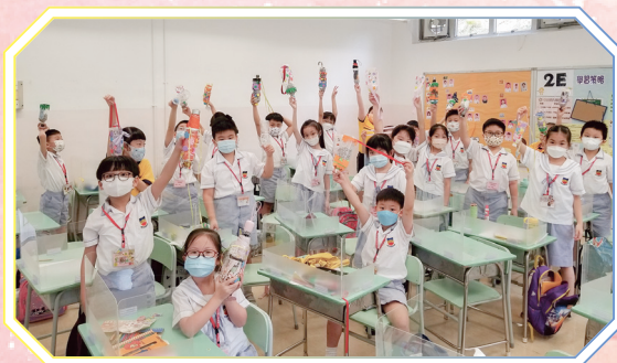
我們終於完成「環保雨傘套」了，很有成功感啊！