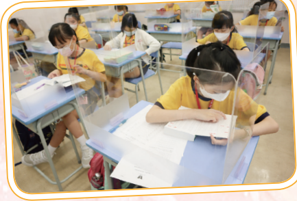
同學們爭分奪秒，務求在查字典比賽中勝出。