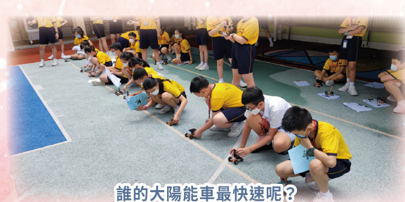
誰的大太陽能車最快速呢？