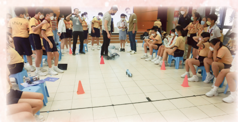
火箭車進行測試了。