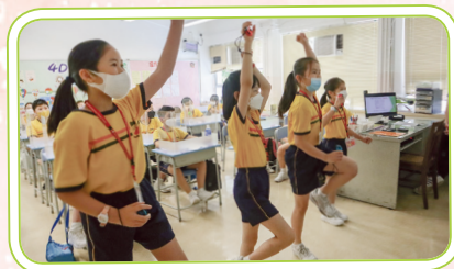
全面提升運動量的體感遊戲。