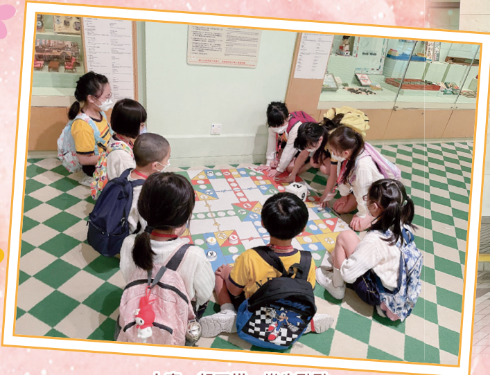
大家一起下棋，樂也融融。