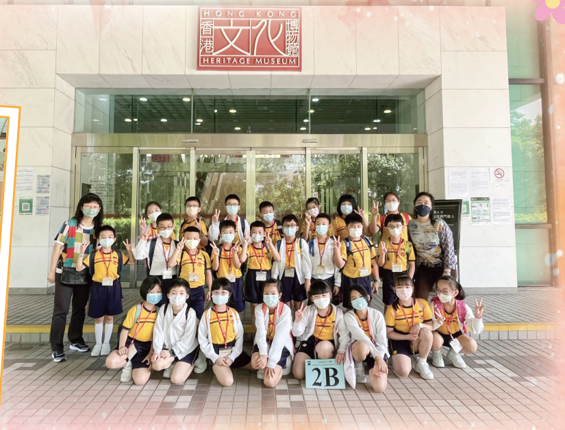
老師帶我們到香港文化博物館參觀，我們獲益良多呢！