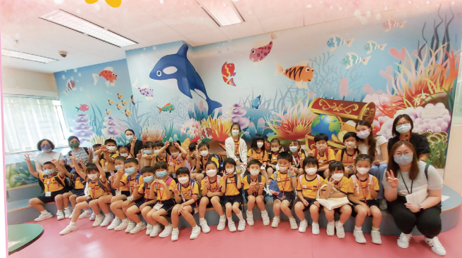
同學參觀鯽魚涌圖書館，心情十分雀躍。