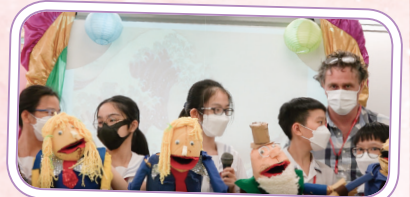
The select team of P.6 students and Mr. C worked together to complete 'Story to Stage' puppetry show.