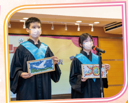
六年級同學向大家介紹致送給母校的紀念品，很有意義呢！