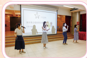
無伴奏合唱令同學耳目一新。