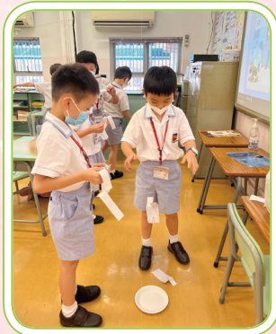
小一同學探究影響紙蜻蜓飛行的因素。