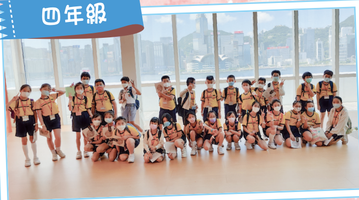
參觀展館前先來一張大合照。