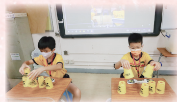
考驗同學手眼協調性的競技疊杯運動。

當天早上，同學精神奕奕地參與升旗禮，然後便參加不同的班際項目。各運動項目有動有靜，同學樂在其中。當天同學們積極參與不同的班際比賽，在競技的同時，亦表現出團隊合作的精神，並能彼此關愛，體會到體育精神的重要性。