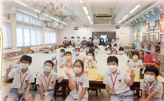
難得可以參與網上直播平台進行的即時互動教學交流活動，當然要合照留念。