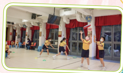
同學在班際躲避盤比賽中全力以赴。