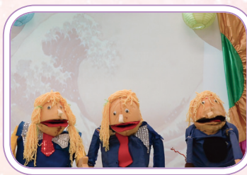
Scene 2 'Old Man Chan'