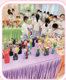
展品色彩繽紛，創意十足。