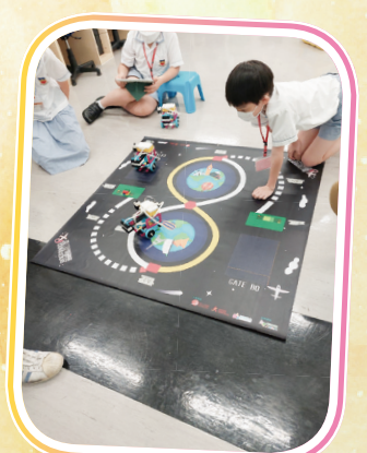
同學參加「智能機械 由我創」比賽。