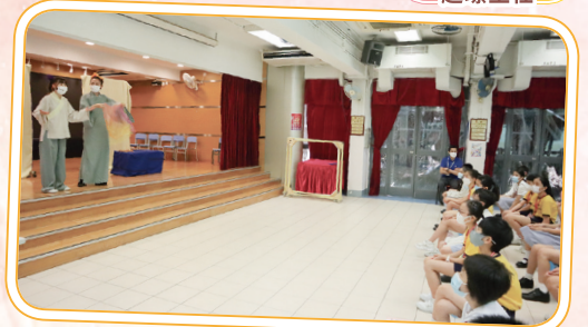
同學聚精會神地觀賞精彩的話劇。