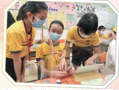
我們討論怎樣修改一下編程內容吧！