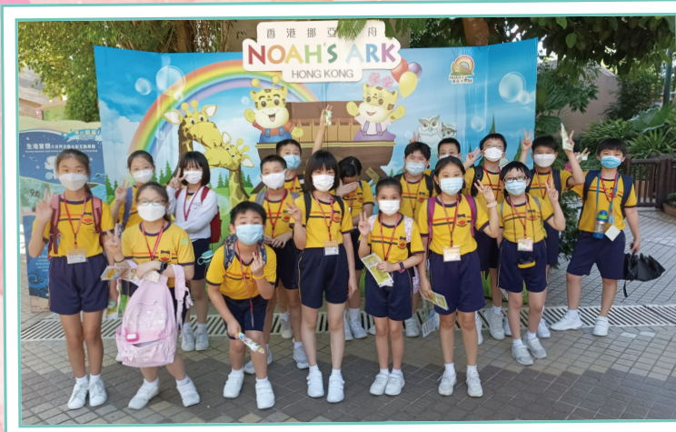
同學到香港挪亞方舟參觀，心情十分興奮。