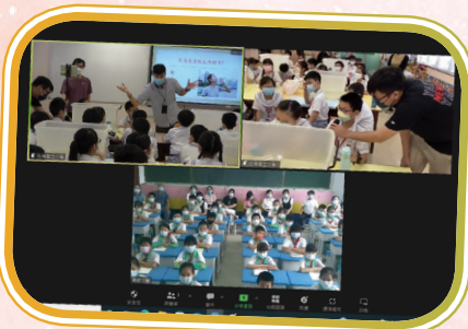
本校學生與梅州興寧市黃嶺小學的學生一起學習。