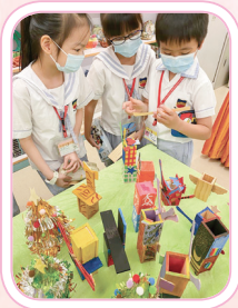
同學細心欣賞展品，準備填寫回饋表，向創作的同學表達支持。

八月二日至八月十日，視藝室舉行作品展覽，展出各級同學優秀的視藝作品，並安排各級同學參觀。展覽完畢後，同學紛紛填寫回饋表，對自己所喜愛的作品表達讚賞，並留言鼓勵創作的同學。這次展覽不但可表揚同學在視覺藝術上的成就，並為學生提供互相欣賞的機會，實在難得。