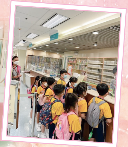
同學們專注地聆聽圖書館管理員講解借還書手續。