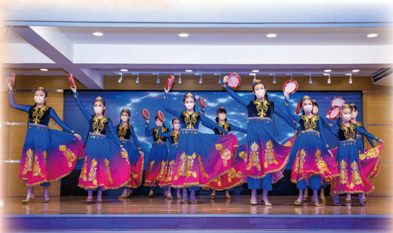
齊來欣賞精彩的中國舞表演吧！表演者的服裝多漂亮！