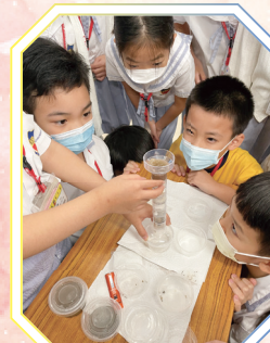
過濾的效果如何呢？