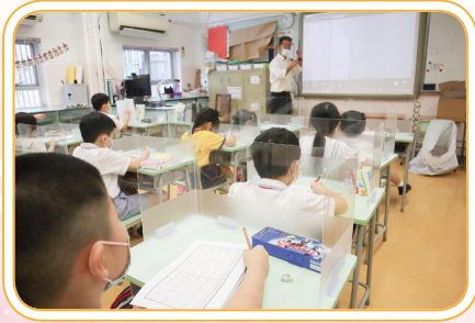
老師從執筆方法著手，教導學生如何寫一手好字。