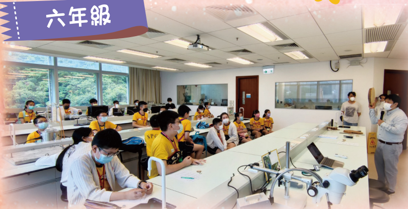
在大學實驗室內聽教授親身講學，機會難能可貴。