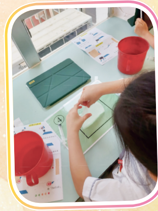
哪款的紙巾最吸水呢？ 齊來做實驗吧！