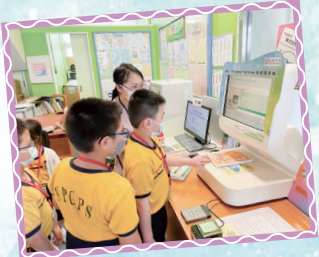
同學學習借還圖書。