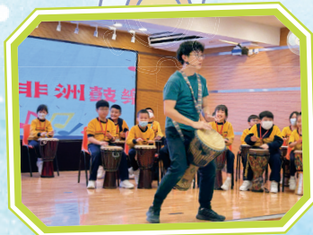
三十多人一起合奏非洲鼓。