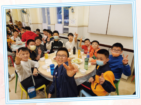
同學們一起享用早午晚三餐，熱熱鬧鬧！