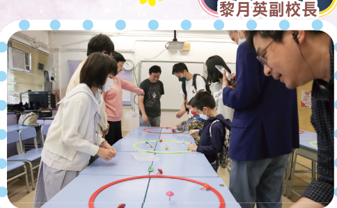
大家玩陀螺玩得不亦樂乎。