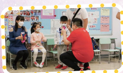
校友會主席細心講解如何踢毽子。