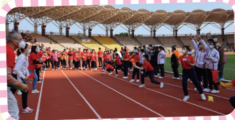
親子比賽緊張刺激。