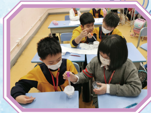
一、二、三……要多少滴才會穿透它？