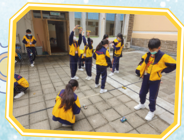
太陽能板的角度要調一下，車子才能走得快。