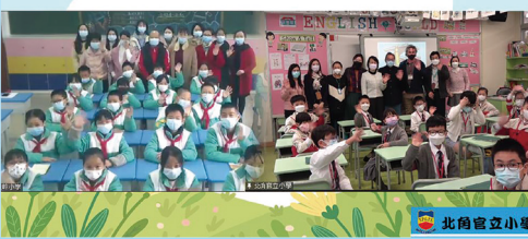
本校與姊妹學校熱烈交流，成效理想！

此外，本校於五月參加由教育局主辦的「2022粵港姊妹學校中華美文誦讀比賽」，由本校及姊妹學校各十一名學生以拍片形式參賽，同聲讚頌祖國。