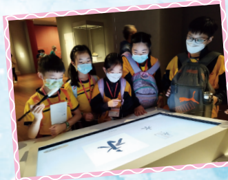
在展館內，同學都搖身一變，成為小小書法家。