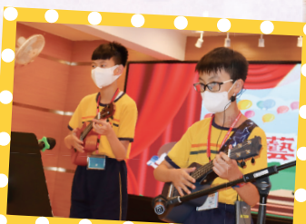
同學自彈自唱，悅耳動聽。