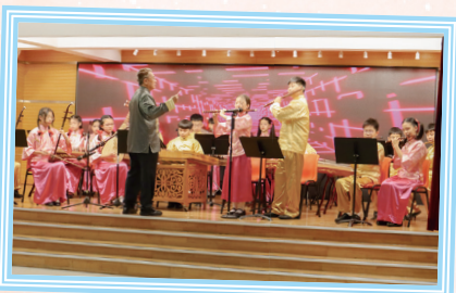
中樂團精彩的表演充分反映同學卓越的才能和優秀的團隊合作精神。