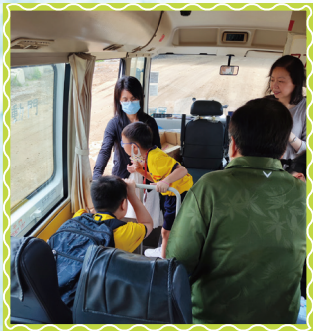
同學拉下口罩聞一聞，發覺原來堆填區一點臭味也沒有。