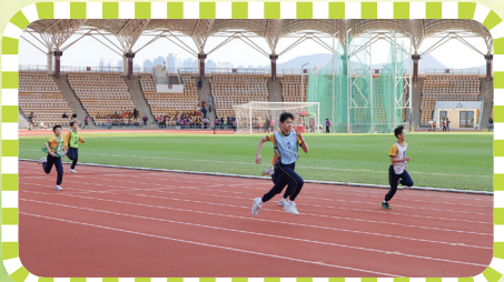
快到終點了，加油啊！