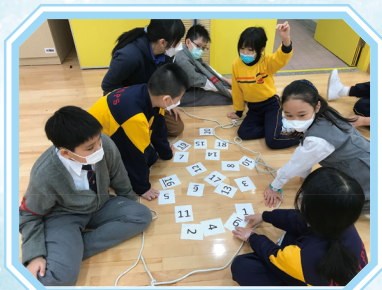
歷奇活動培養大的家協作能力。