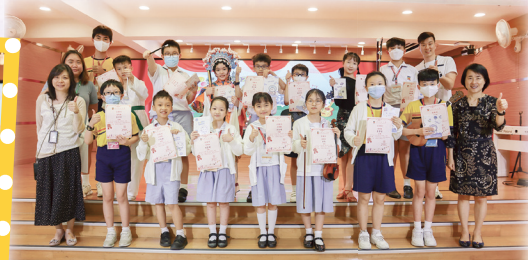
同學表演後獲得校長頒發證書及禮物。