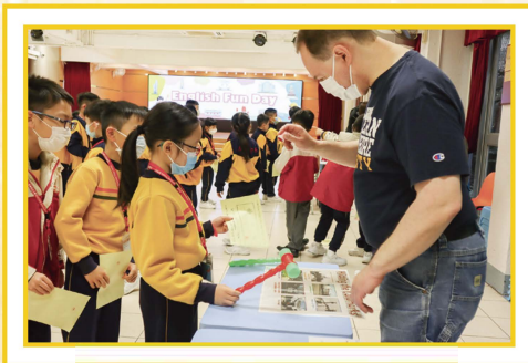
Students were engaged in English Fun Day.