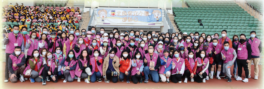
家長義工團陣容龐大。