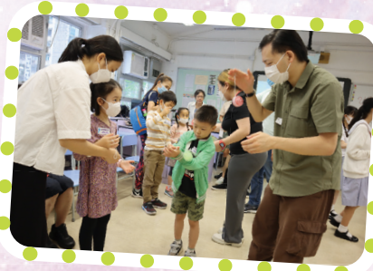
校友義工示範玩搖搖，參加者專注學習。