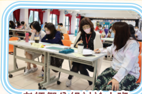
老師們分組討論小班教學的策略。