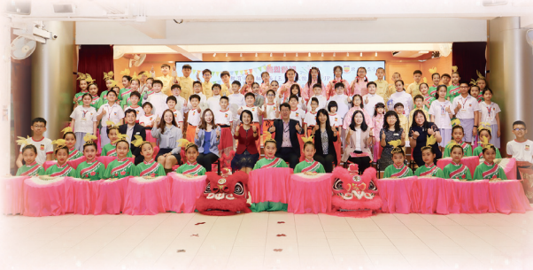
嘉賓十分欣賞校隊成員的落力演出，大家來個大合照留念。