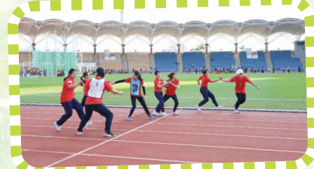
親子接力賽中，家長和同學全力以赴。