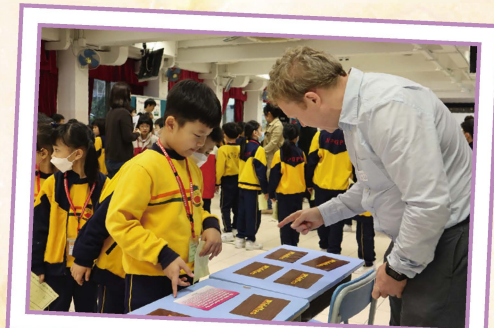
The tutor guided students to finish the task patiently.