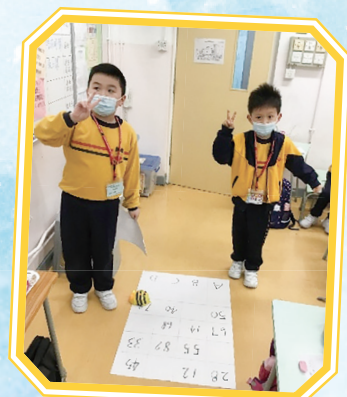
成功輸入指令，讓Bee-Bot走到正確的方格中。