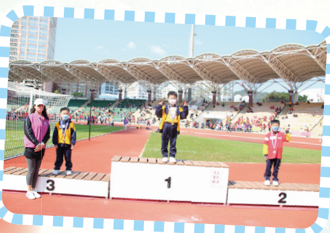
一年級男子60米賽跑得獎者。