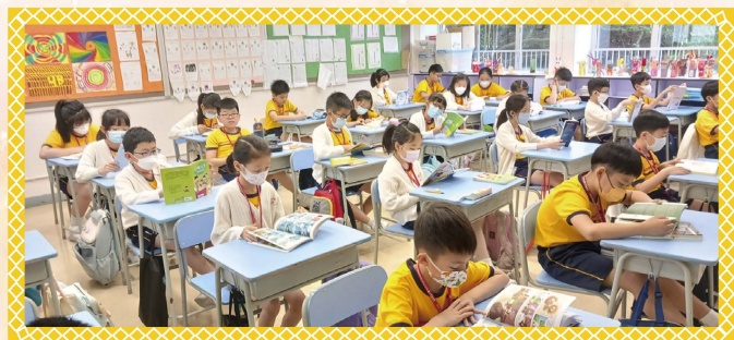
同學們很專注地閱讀圖書。