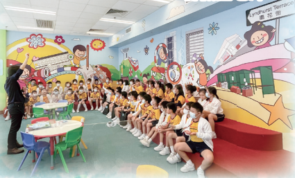
同學專心地聆聽館長講解圖書館規則。