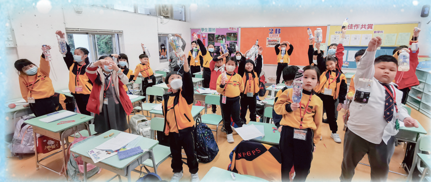
看看誰製作的環保雨傘套最美吧！