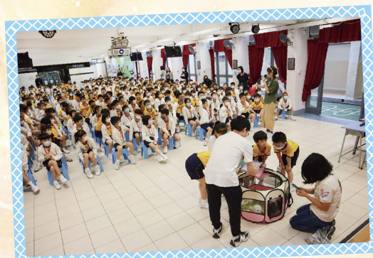
繪本故事講座的特別嘉賓就是兔子先生。