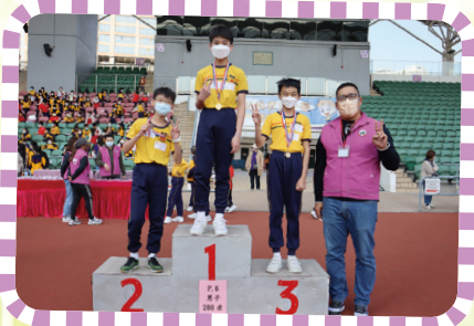
六年級男子200米得獎者。