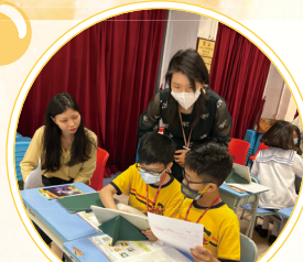
同學們積極主動地使用電子媒體學習。

香港教育大學的內地準老師均對授課老師的教學和學生的學習表現給予了正面的回饋。此外，他們亦表示對香港小學生學習英文的狀況有更深的認識和了解。是次交流無論對香港教育大學的學員，還是我們的師生都獲益良多，期望將來能與香港教育大學有更多的合作機會，不斷提升本地英語教學的質素。