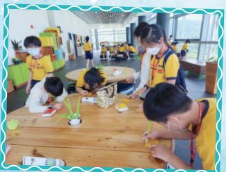
同學在T·PARK[源·區]欣賞景色及填寫心意卡。