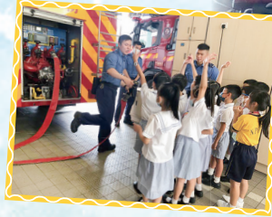
同學們積極回答消防員的提問，反應熱烈。