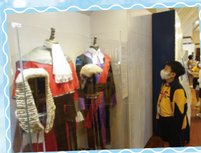
同學細心欣賞法官的服飾。