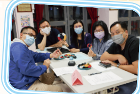
老師們運用Tublock和micro:bit創作產品。