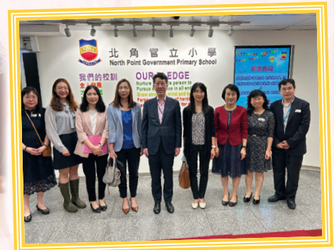
教育局官員到訪本校，深入認識本校的實際運作情況。