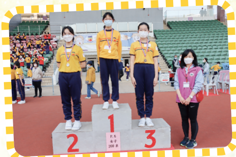
五年級女子200米賽跑得獎者。