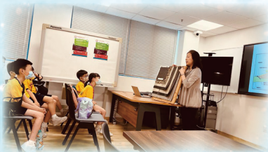
新界東南堆填區導賞員正為學生講解堆填區的內部結構。