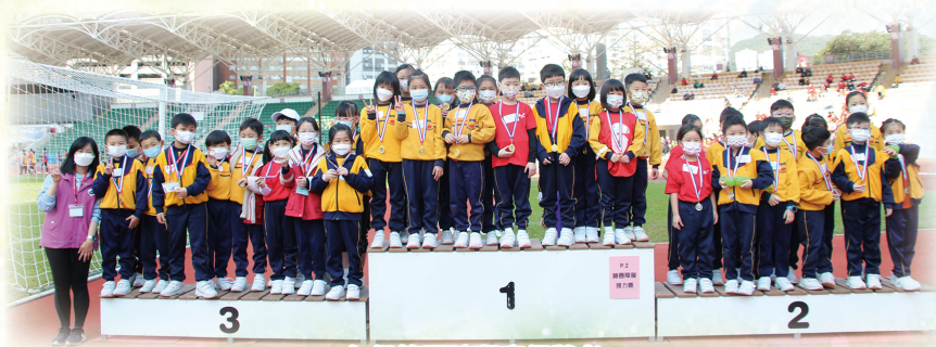
二年級籃圈障礙賽得獎者。