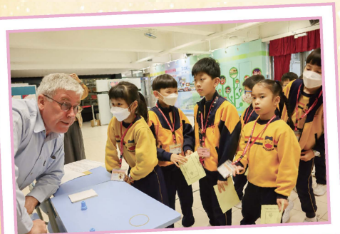
Students completed the activity by communicating with the tutor in English.