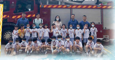
同學們一起參觀消防局，獲益良多呢！