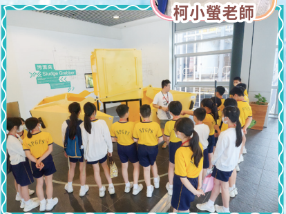
同學專心聆聽導賞員介紹處理污泥的工具。