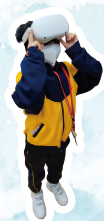
用VR來體驗非洲的天與地。