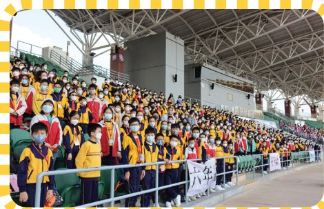
比賽前，同學先參與升旗禮。

這次運動會能夠圓滿舉行，除了師生們的努力外，實在有賴一群家長義工的協助，這實在是家校合作的又一見證。