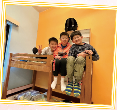
好友暢談，成美好愉快的回憶。