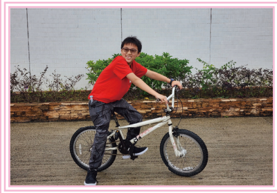
想不到在營中也可踏單車，真高興呢！

學生們在營內可以接觸大自然，學習如何保護環境及欣賞大自然。他們亦可參加多姿多采的戶外活動，例如騎自行車、踢足球、射箭和參加繩索訓練等。此外，營地也提供了一些室內活動，如打羽毛球、打乒乓球、玩康樂棋和攀石等，讓學生們可以體驗不同的活動，學習不同的技能。