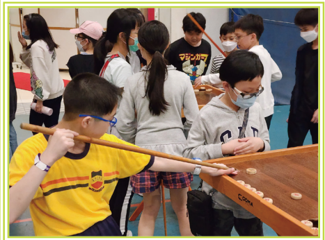
齊齊一比高下，看看誰是康樂棋高手吧！

小六畢業營是一次難忘的學習經歷，留下了同學們成長的足跡，相信對他們未來的學習和生活受益匪淺。