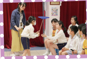
同學表演之餘，亦與台下觀眾互動。

本學年的第二次小藝墟活動已於四月二十三日（低年級）及五月三日（高年級）順利進行，共有三十一名同學參與，表演項目多不勝數，包括：京劇、拉丁舞、雜耍、唱歌、彈琴、跆拳道及打鼓等等，節目內容十分豐富。表演前，同學用心練習及綵排；表演時，同學施展渾身解數，獲得台下不少掌聲。