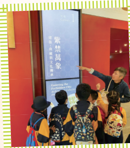
同學們耐心聆聽導賞員的講解。

為了提升非華語學生對中國文化及歷史的認識，本校於三月二十五日（星期六）安排了九位同學前往香港故宮文化博物館及M+博物館參觀，擴闊他們的學習經歷。活動期間，同學們表現投入，對中國古代文化展品表現出濃厚興趣。參觀完畢及聆聽導賞員的講解後，大家對中國的文化和歷史都更有深入的認識及了解。