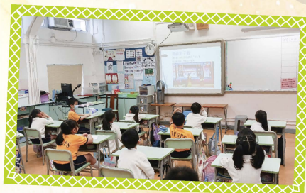
同學們全神貫注地欣賞粵劇。

活動當日，師生都積極投入地參與，反應熱烈，相信多姿多采的「閱讀日」活動定能讓師生更「喜閱」。