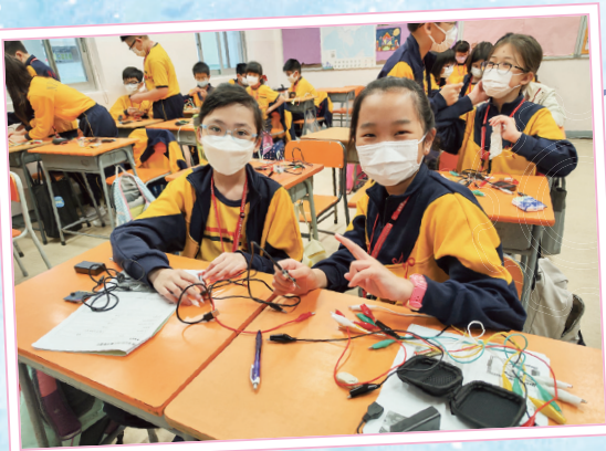
合作接駁串聯和並聯的閉合電路。