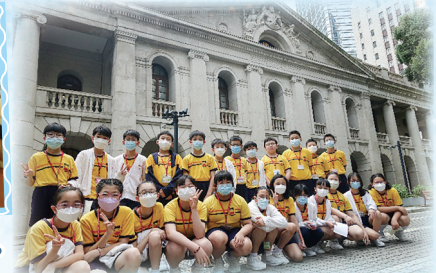
大家在終審法院前合照留念。