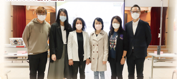
校長和「作Code家」工作坊的講者及工作人員合照留念。