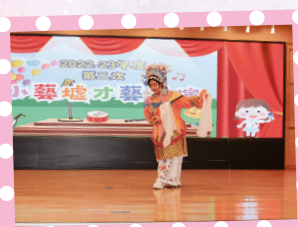
同學的京劇演出功架十足。