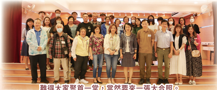
難得大家聚首一堂，當然要來一張大合照。