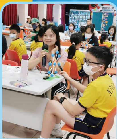
家長樂於分享這次活動感受