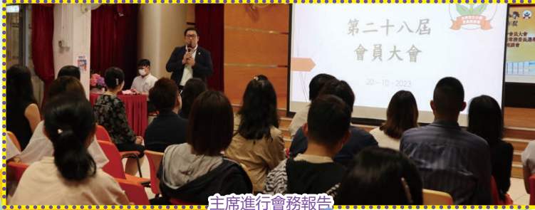
主席進行會務報告