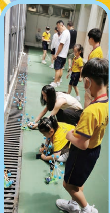
期待着陽光帶動摩天輪轉動