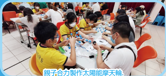
親子合力製作太陽能摩天輪