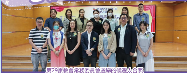
第29家教會常務委員會選舉的候選人合照