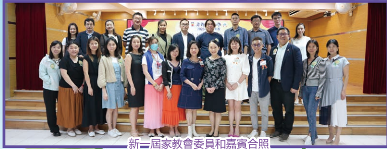
新一屆家教會委員和嘉賓合照